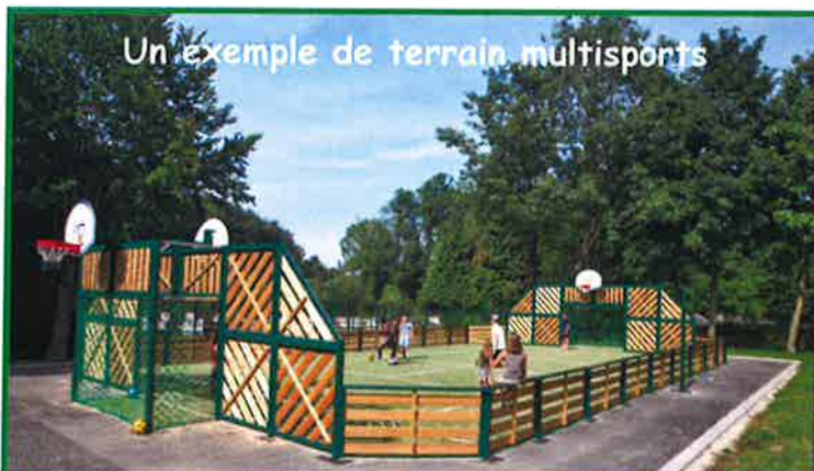
Un exemple de terrain multisports

« Qui a dit que les jeunes de Pouzilhac n'étaient pas dynamiques ? »